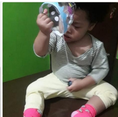
A Isa...com seu brinquedinho q a mamãe fez 🥰

Deixar o bebê explorar alimentos com texturas e temperaturas diferentes, faz com que o mesmo crie autonomia para se alimentar, e definir seus gostos.